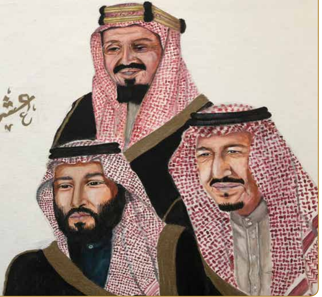
رسم/ نوال علي كلية التمريض