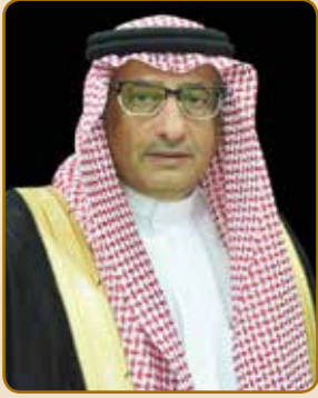
مدير الجامعة أ.د. فلاح بن فرج السبيعي